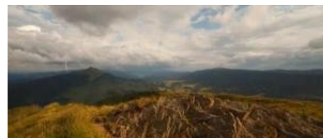
Podkarpacie - region innowacji