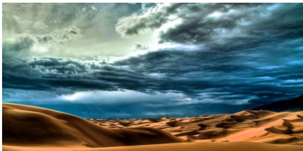
Wakacje pustynia